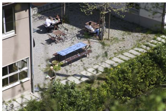
Restaurant mit Garten