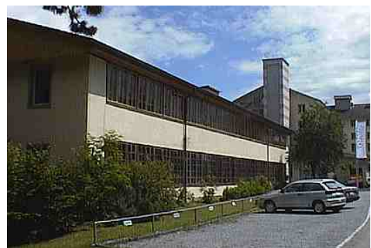
Ansicht alte Weberei von West