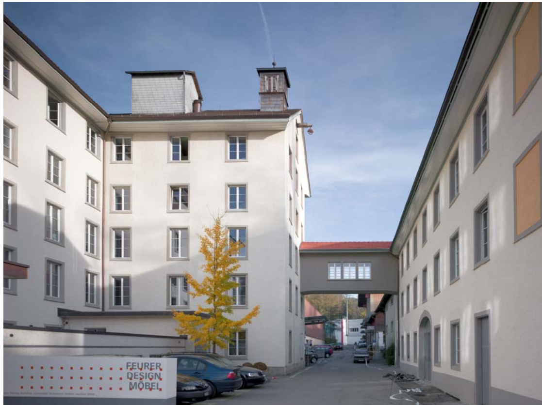
links Spinnereigebäude mit Besucherparkplatz, rechts Bürogebäude

Trümppler AG, Aathalstrasse 84, 8610 Uster Tel. 044 941 85 00, Fax 044 941 85 54