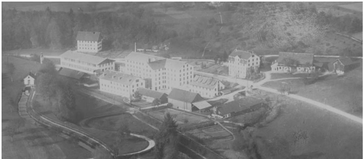
Trümplerareal um 1900

Web- und Spinnmaschinen verbieten wollte. Genau 2 Jahre später, am 22. November 1832 brannten die um Ihre Existenz bangenden Heimarbeiter und Kleingewerbler die neu gebaute und mit modernsten Maschinen ausgerüstete Fabrik des heutigen Trümplerareals nieder. Doch wie die Geschichte zeigt, war die Entwicklung zur Industrialisierung dadurch nicht aufzuhalten.