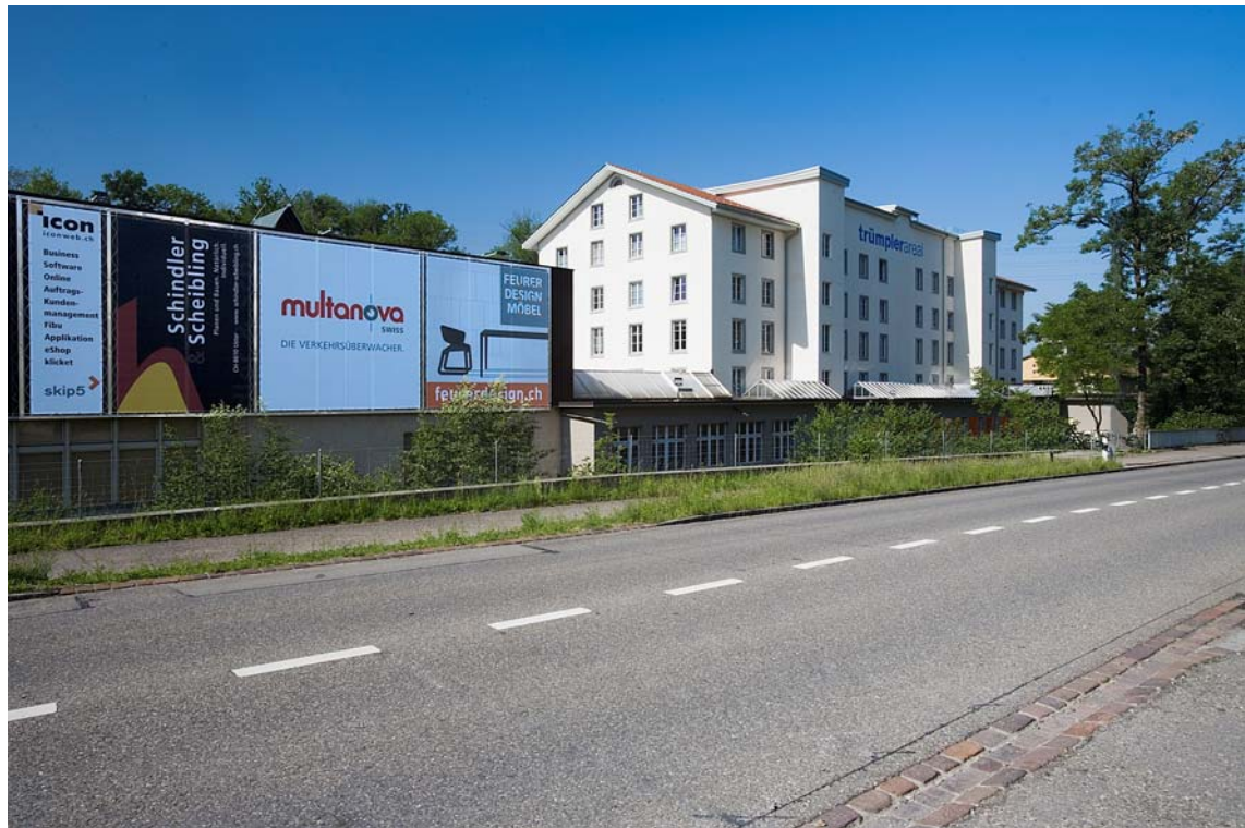
Spinnereigebäude Nordfassade mit Plakatwand

Trümpler AG, Aathalstrasse 84, 8610 Uster Tel. 044 941 85 00, Fax 044 941 85 54