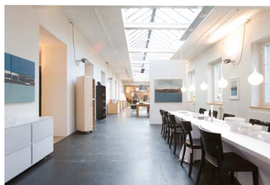
Verkaufslokal EG Spinnerei